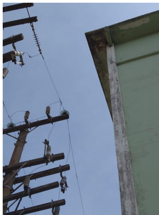
Figura 2 - Início das galerias subterrâneas de A.T.