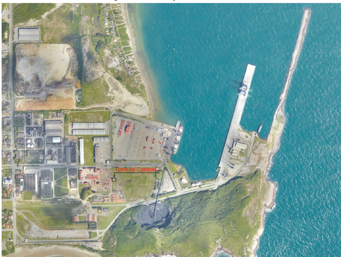
Figura 03 – Edificação a ser demolida

A execução dos serviços de remoção e demolição da edificação denominada “TERFRIO” está localizada na área apresentada na Figura 03 a seguir.