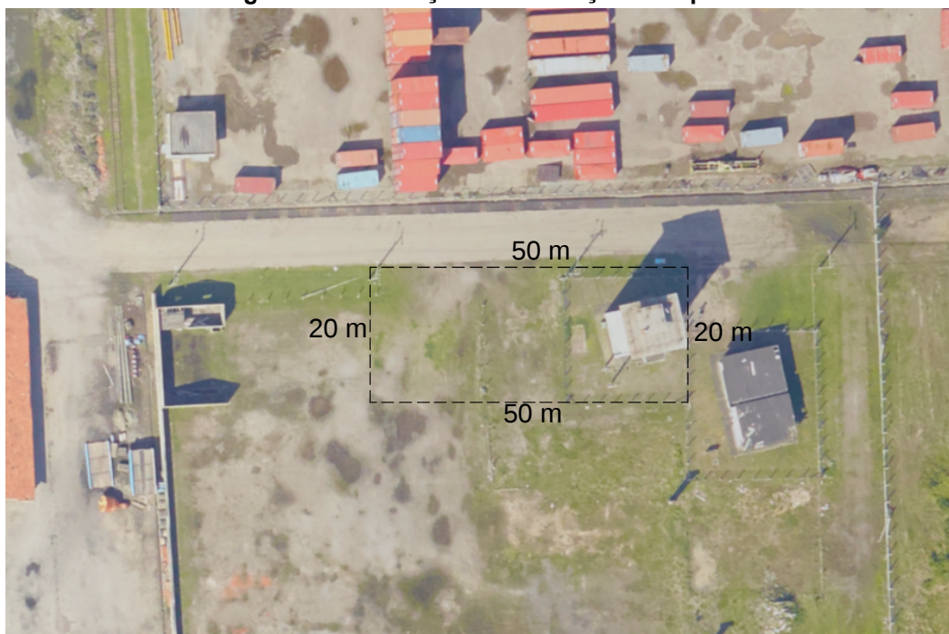
Figura 05 – Indicação de instalação de tapume