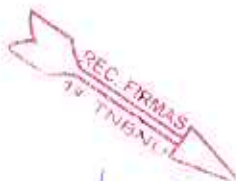
INEZ DAGOSTIN Eagle Soluções Tecnológicas Eireli