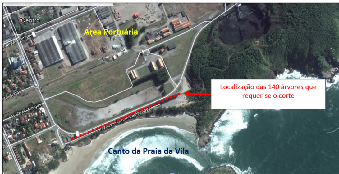
Figura 1 – Localização da vegetação suprimida

O serviço a ser executado consiste na execução do projeto de recomposição vegetal, estabelecido no processo VEG/79435/CTB, referente a supressão de 140 unidades de árvores de espécie exótica ( Casuarina equisetifolia ), localizada na lateral da cerca de divisa da área portuária com a Avenida Manoel Florentino Machado, conforme a imagem abaixo: