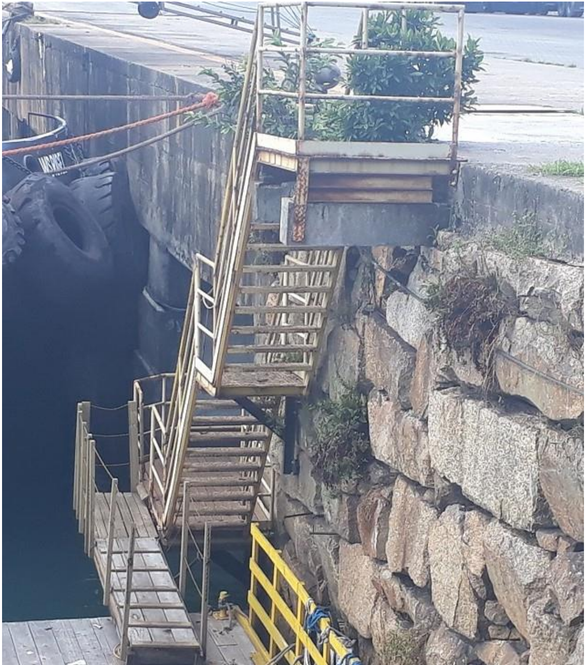
Figura 09 – Plataforma da escada e sistema de fixação corroído (Cais 1)