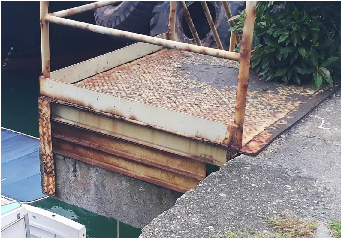
Figura 10 – Sistema de fixação corroído (Cais 1)