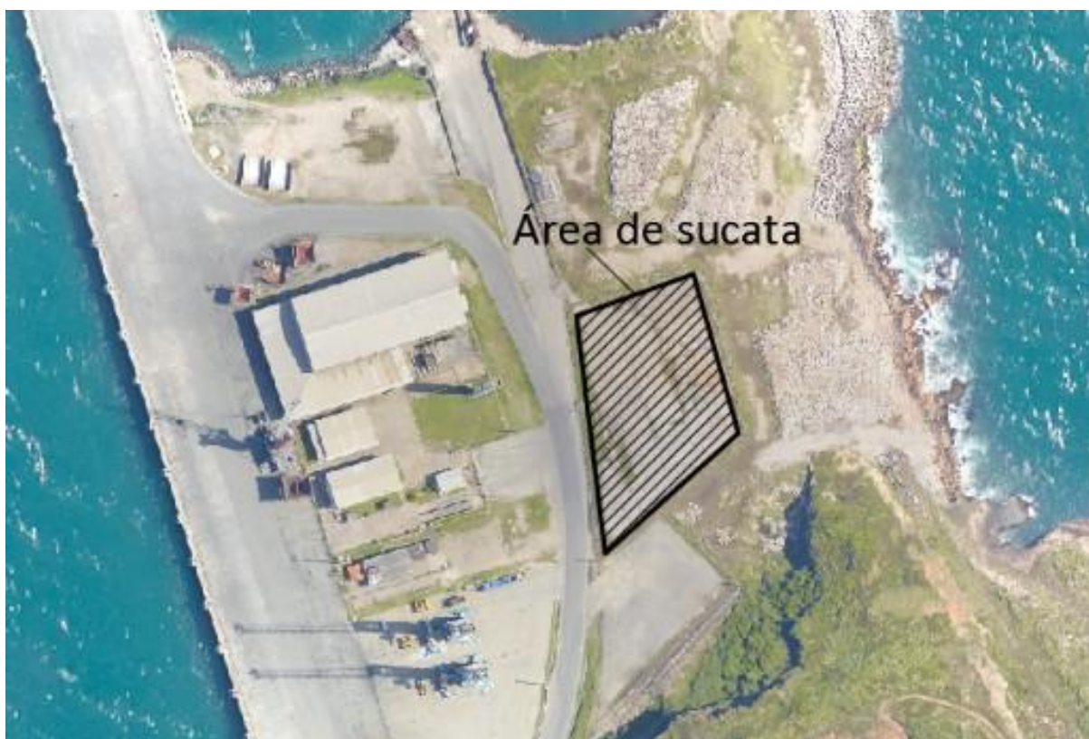
Figura 02 – Área destinada ao estoque de sucatas

A empresa contratada deverá providenciar a remoção da escada e os guarda-corpos descritos neste Termo de Referência e transportá-los até uma área designada pelo fiscal do contrato dentro do Porto de Imbituba, destinada para estoque de sucatas.