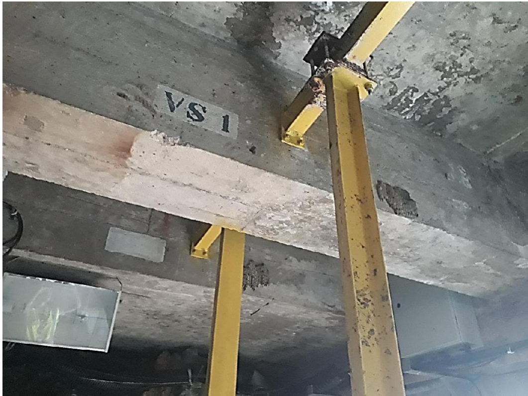
Figura 15 – Sistema de fixação da escada existente (Cais 1)