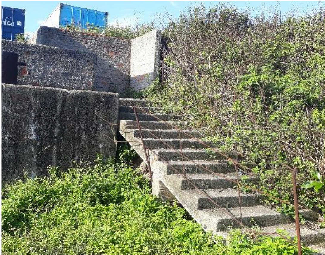
Figura 06 – Calçada de acesso à administração