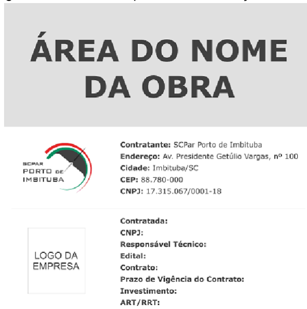
Figura 01 – Modelo de placa de identificação da obra

da NR 18. Para este item, considerar a limpeza do banheiro a cada quinze dias e a instalação do mesmo será em local a ser especificado pela equipe técnica da Contratante.