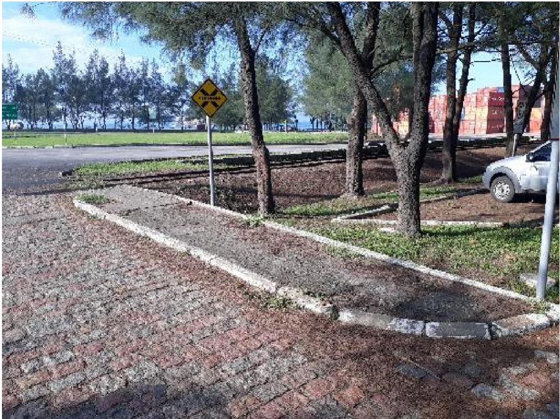
Figura 07 – Calçada de acesso à administração