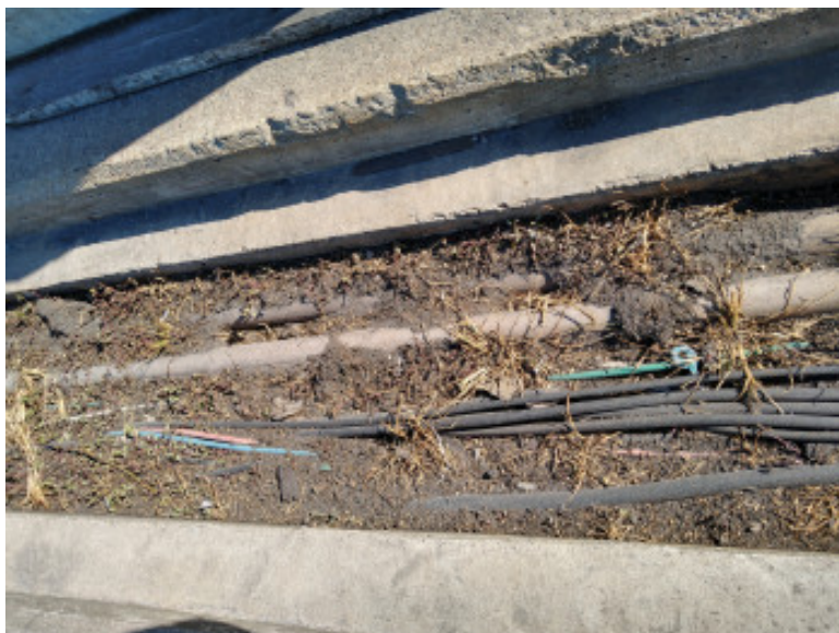
Figura 2 - Condição atual da canaleta do Cais 2.