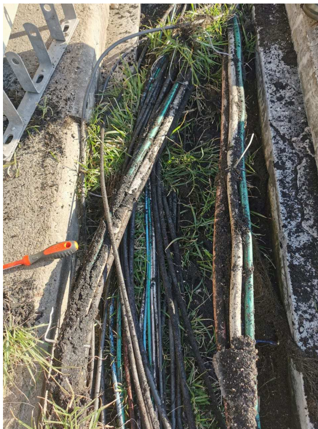
Figura 4 - Condição atual da canaleta do Cais 2.