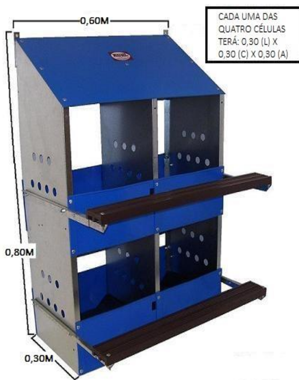
Figura 2. Pombal para 4 ninhos