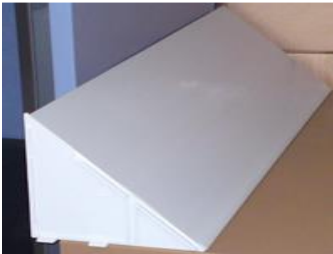
Figura 3. Dispositivo do tipo Bird Slope Bird Repellent .