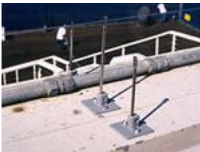
Figura 6. Sistema de arames do tipo post and wire stick on base .