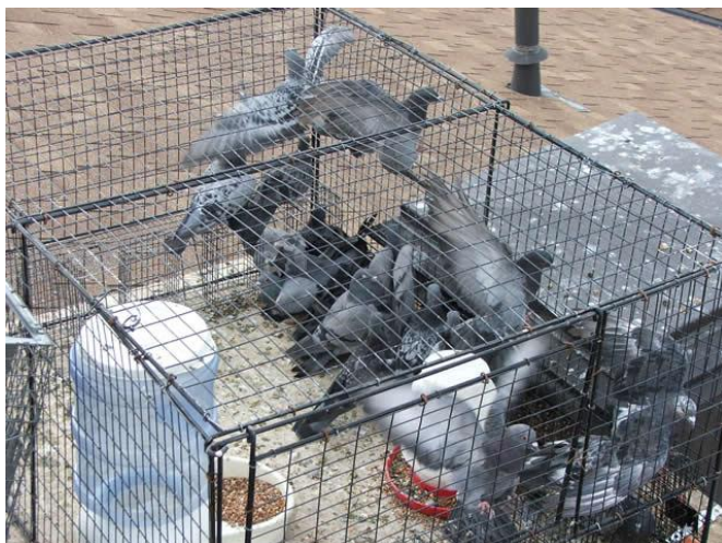
Figura 5. Armadilha do tipo multicaptura.