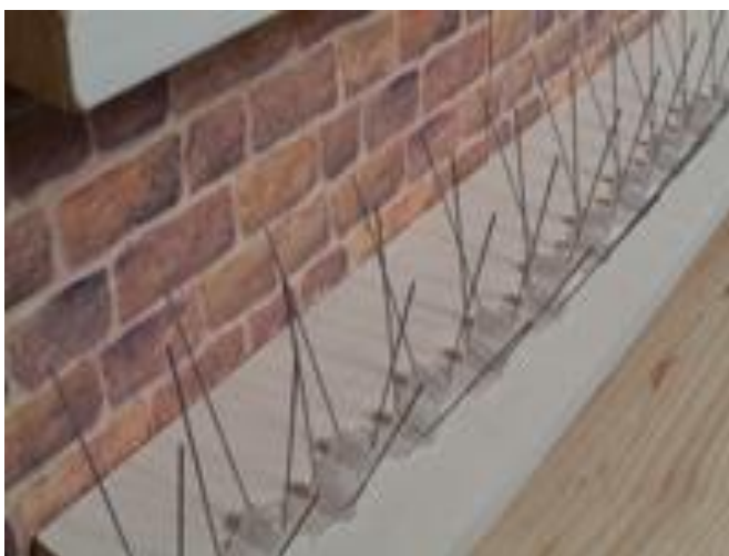
Figura 4. Espículas do tipo Anti-roostingpigeonspikes .