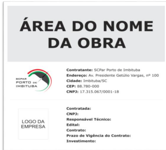
Figura 01 – Modelo de placa de identificação da obra

2.1.2 Tapume em cerca de isolamento na cor laranja altura 1,20 m: deverá ser considerada a instalação de tapumes em cerca de isolamento na cor laranja com perímetro de aproximadamente 600,00 metros. Os tapumes deverão apresentar altura mínima de 1,20 metros e farão o devido isolamento da área, permitindo o acesso de apenas pessoas autorizadas a ela.