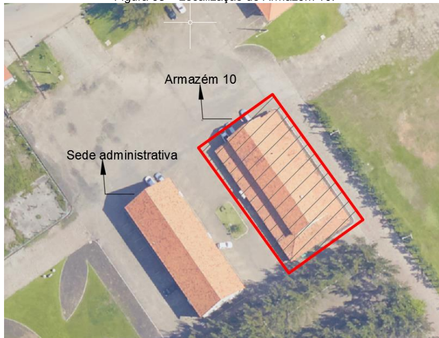
Figura 03 – Localização do Armazém 10.

Os serviços de reforma serão prestados no Porto de Imbituba, no local designado na planta em anexo como Armazém 10, prédio vizinho ao prédio administrativo.