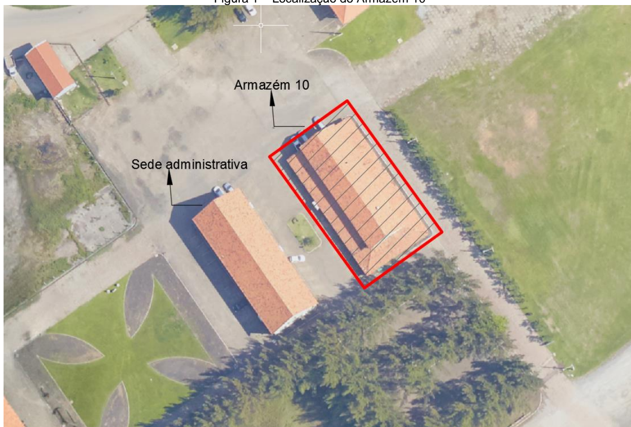
Figura 1 – Localização do Armazém 10

Os serviços contratados estão dispostos em um Cronograma Físico geral de todas as etapas envolvidas , o qual segue anexo a este documento, para que seja possível conciliar a execução de todas as atividades e para que todos os serviços sejam executados dentro do planejado. O cronograma objetiva facilitar e detalhar cada etapa de execução, de modo que fiquem claras as etapas referentes aos serviços englobados por esta contratação. Além disso, segue anexa também uma planilha orçamentária com os quantitativos detalhados e as estimativas dos serviços especificados.