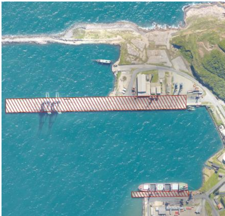
Figura 06 – Área para execução dos ganchos

A execução dos serviços de remoção, confecção e instalação dos ganchos de amarração no Porto de Imbituba será realizada nas áreas abrangidas do cais 01, 02 e 03, conforme apresentado na Figura 06 a seguir. A localização e a posição dos ganchos serão decididas pela Fiscalização.