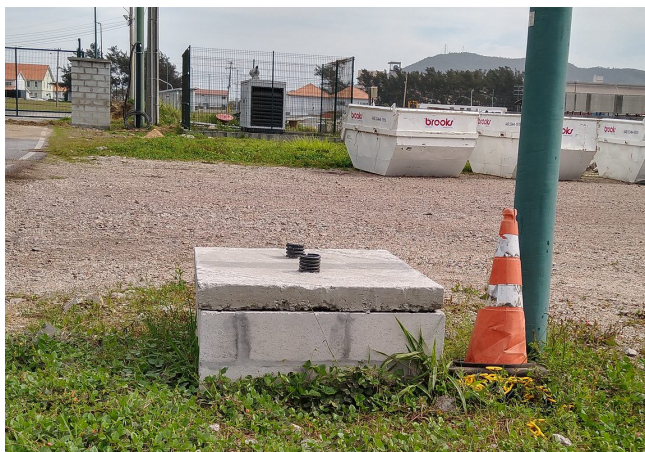
Figura 1 - Exemplo de caixa elevada (desconsiderar tampa).