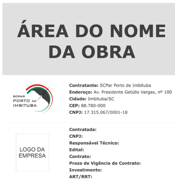
Figura 9 – Modelo de placa de identificação da obra

Aluguel de container para escritório (largura: 220 cm/comprimento: 620 cm / sem divisória): deverá ser considerado o aluguel de um container para o armazenamento de materiais e suporte aos operários durante a obra a ser instalado em local a ser especificado pela equipe técnica.