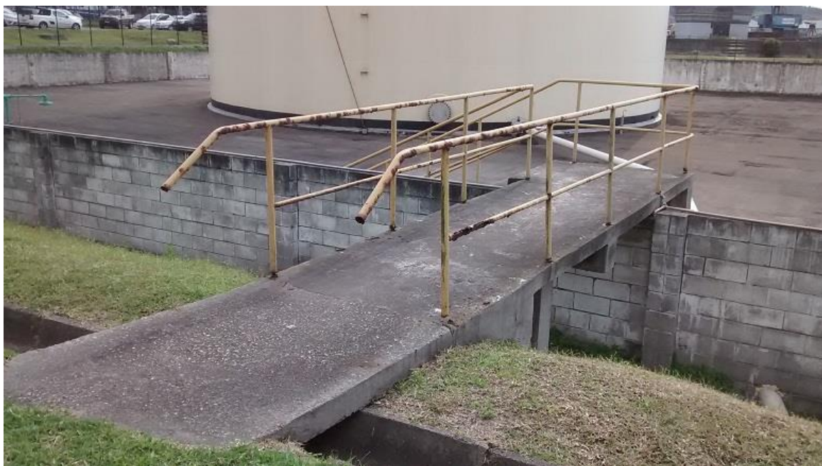
Figura 1 – Local da instalação dos guarda-corpos (Escada 1)