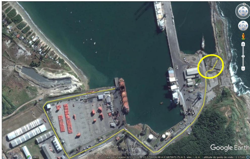
Figura 02 – Localização do material de 3ª categoria e trajeto até o local danificado

Data da imagem: 13/06/2016