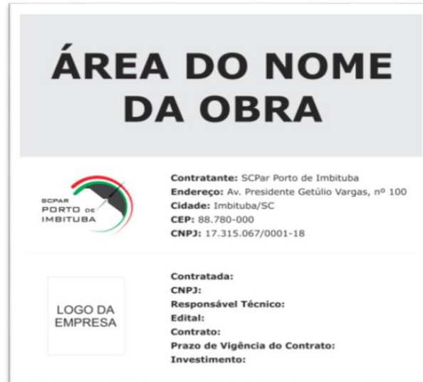
Figura 01 – Modelo de placa de identificação da obra

2.1.2 Tapume em cerca de isolamento na cor laranja altura 1,20 m: deverá ser considerada a instalação de tapumes em cerca de isolamento na cor laranja com perímetro de aproximadamente 100,00 metros. Os tapumes deverão apresentar altura mínima de 1,20 metros e farão o devido isolamento da área, permitindo o acesso de apenas pessoas autorizadas a ela.