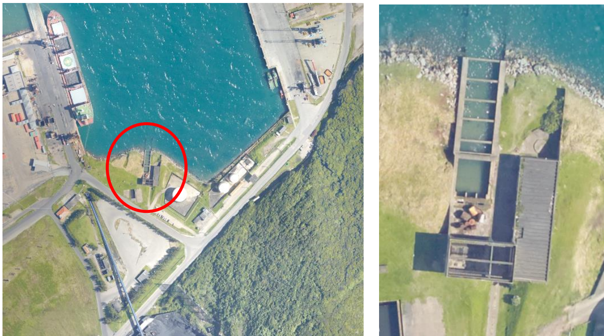
Figura 03 – Área para ser demolida