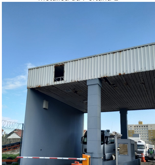
Figura 2: Imagem frontal aproximada da cobertura metálica da Portaria 2