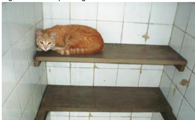
Figura 18. Exemplo de gatil.