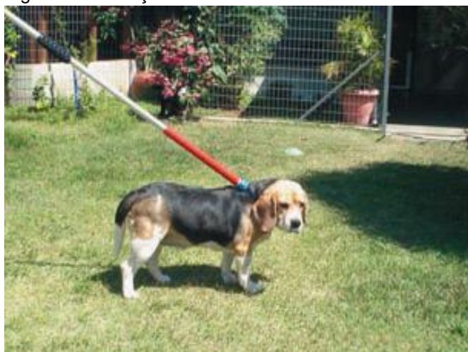
Figura 5. Condução do cão com cambão.