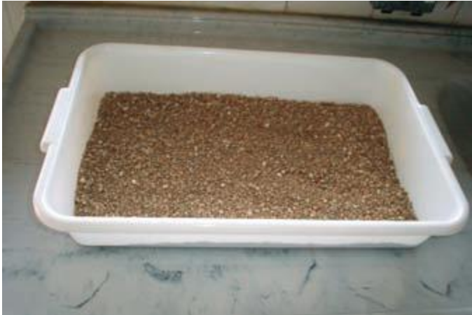
Figura 20. Bandeja plástica para dejetos.