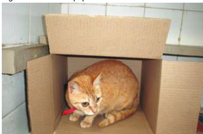
Figura 19. Caixa de papelão.