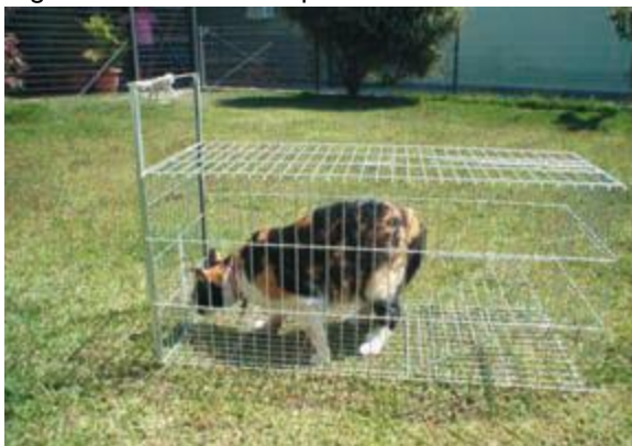
Figura 15. Diferentes tipos de armadilhas.