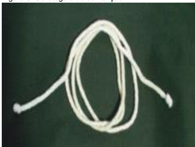
Figura 6. Corda/guia de contenção.

Corda/guia de contenção: pode ser tecido em fibra de algodão ou outro material macio, resistente e maleável, com espessura mínima de 8 mm para não ferir o animal (Figura 6).