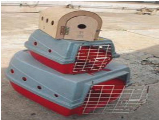
Figura 16. Caixa de transporte.

Caixa/gaiola de transporte: confeccionada em material leve, lavável, preferencialmente impermeável, resistente e com ventilação, sistema externo de fechamento seguro e alças para facilitar o transporte. É utilizada para o alojamento temporário ou transporte do animal recolhido. O tamanho da caixa ou gaiola deve ser compatível com o porte do animal, de forma a permitir movimentos naturais e o transporte confortável (Figura 16).