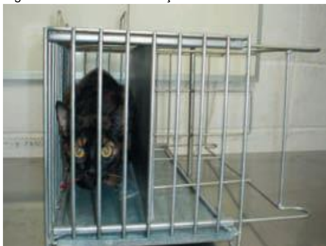
Figura 17. Gaiola de contenção.