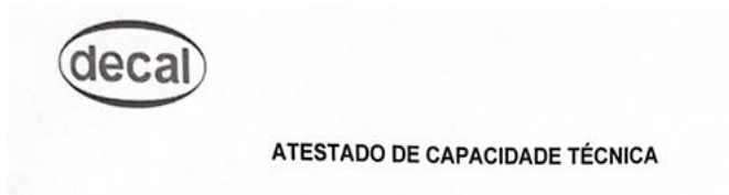
Figura 7 - papel timbrado DECAL