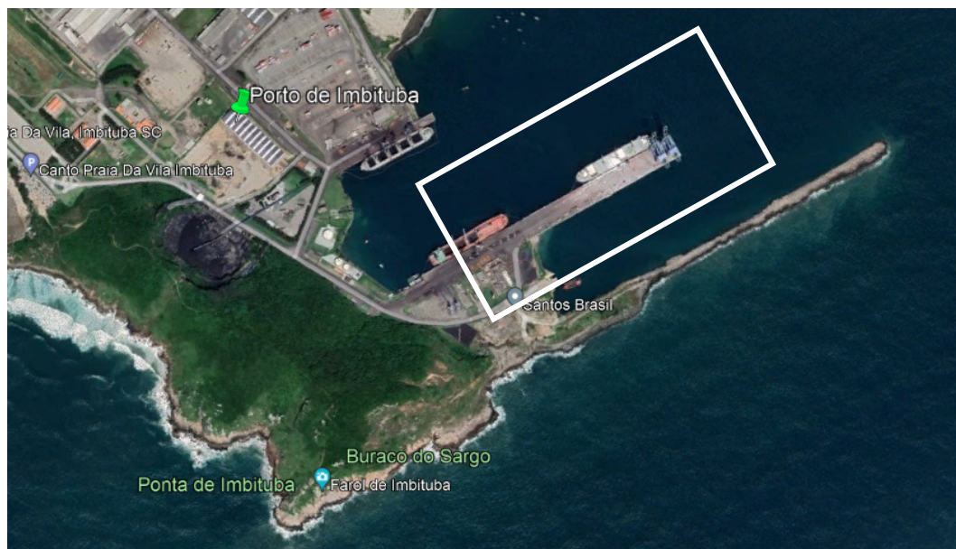
Figura 2 - Localização do Porto de Imbituba / SC(28°13'56.00"S; 48°39'8.00"O)